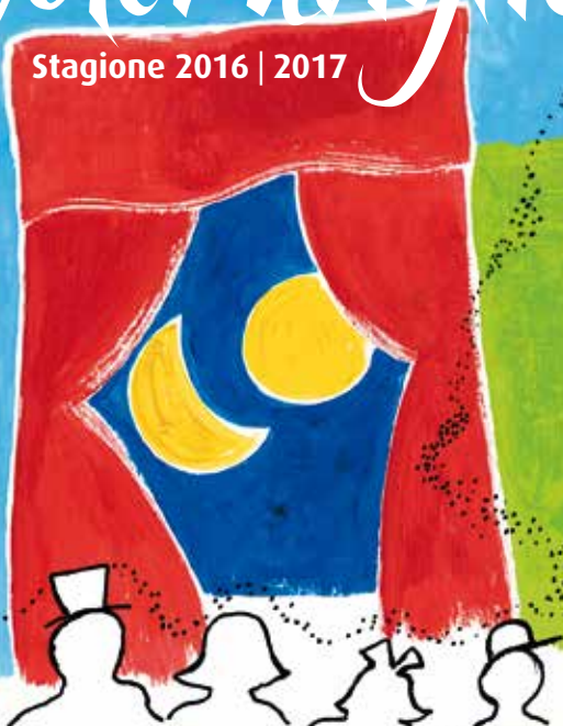
illustrazione di Fernanda Ghirardini