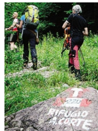
In cammino verso il rifugio

Resterà aperto fino al 7 gennaio Prenotazioni per il cenone