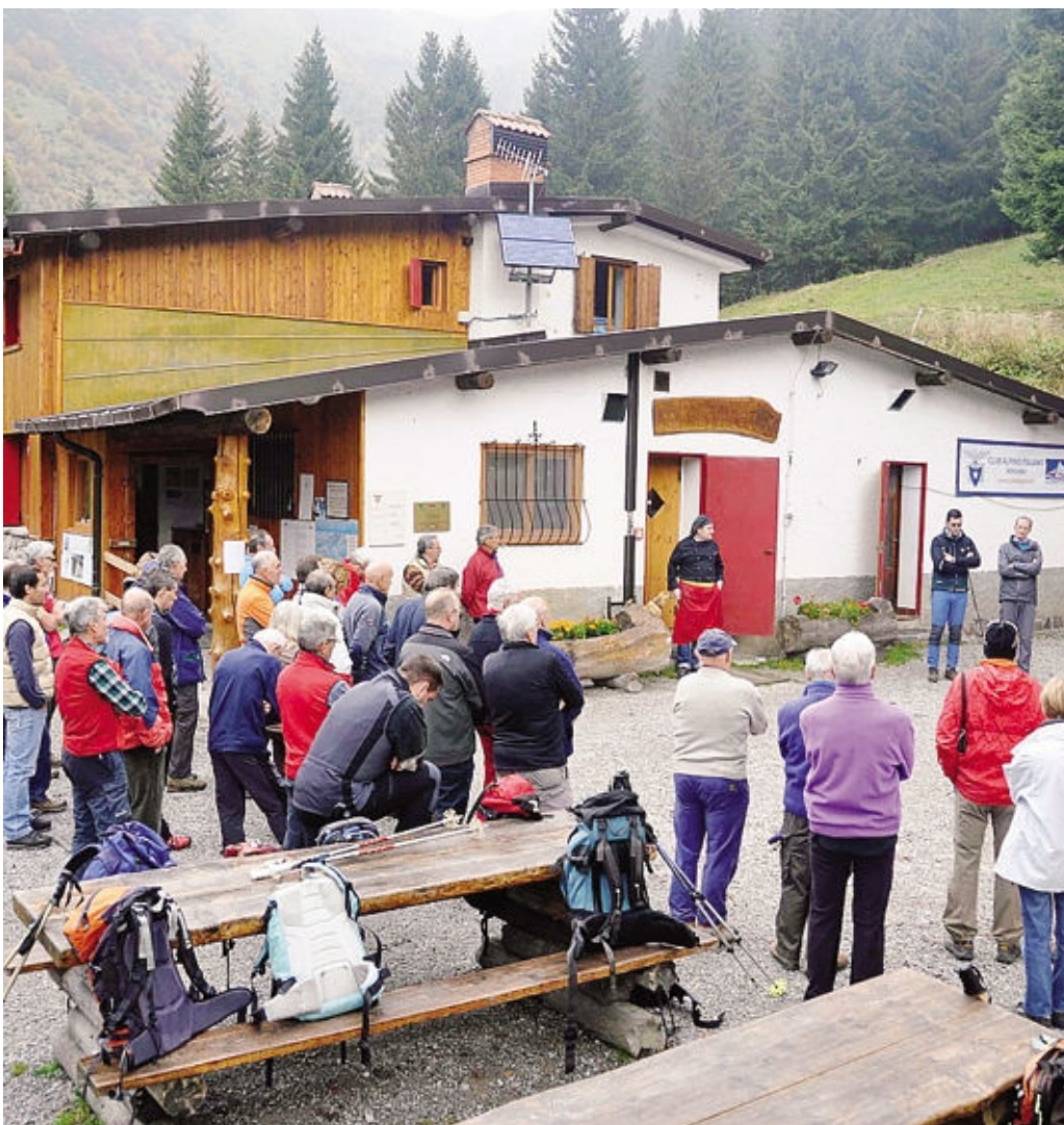
A sinistra il logo dei rifugi senza barriere. Sopra, l'Alpe Corte

Dopo un'attenta analisi di tutte le proposte, con la presenza delle istituzioni del territo-